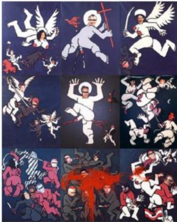
otto muehl: apocalypse (nach attacke)

'The Court reiterates that freedom of expression, as secured in paragraph 1 of Article 10, constitutes one of the essential foundations of a democratic society, indeed one of the basic conditions for its progress and for the self-fulfilment of the individual. Subject to paragraph 2, it is applicable not only