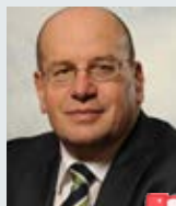
Fred Teeven voormalig staatssecretaris van Veiligheid en Justitie, VVD