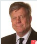
Ivo Opstelten voormalig minister van Veiligheid en Justitie, VVD