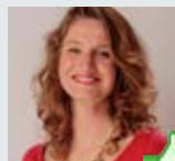
Sharon Gesthuizen Tweede Kamerlid SP