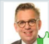
Gerard Schouw Tweede Kamerlid D66